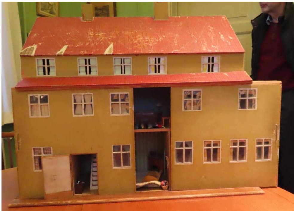
Huset har to skydeforsider, der åbnes når der skal leges